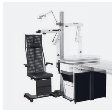
Höhenverstellbar height adjustable

The new, compact, height adjustable refraction and examination unit VarioCarat is the smallest telescopic table unit made by BLOCK.