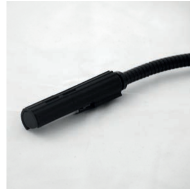
LED Leseleuchte mit Schwanenhals LED reading light with swan-neck