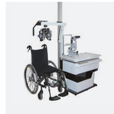
Optimal für Rollstuhlpatienten perfectly for wheelchair patients

The optional electromotive height adjustment (approx. 73 – 93 cm) is able to adjust the required height infinitely. Patients of any size or wheelchair patients can be examined perfectly. The unit VarioCarat also provides the examiner with an ergonomically optimized workplace. The unit has an electromotive telescopic table for instruments, an electromotive phoropter arm and many other options. As usual we offer you the opportunity to customize the unit to your individual needs.