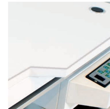
Beleuchtete Folientastatur sealed keypad with illumination