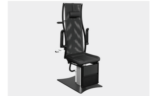
verstellbare Armlehnen adjustable armrests