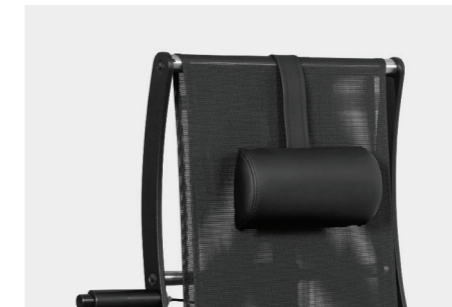
verstellbare Nackenstütze adjustable neck support