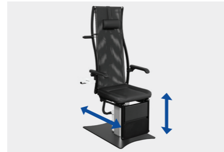
elektromotorische Höhenverstellung, manuelle oder elektromotorische Sitzverschiebung electromotive height adjustment, manual or electromotive seat adjustment