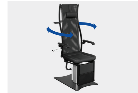
Drehmechanik alle 90° bei elektromotorischer Sitzverschiebung nur bis 180°, bei manueller Sitzverschiebung bis 360° rotation mechanism every 90° with electromotive seat adjustment only up to 180°, with manual seat adjustment up to 360°