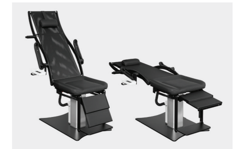
manuell oder elektromotorisch stufenlos neigbares Stuhloberteil manually or electric motor steplessly inclinable upper part of the chair