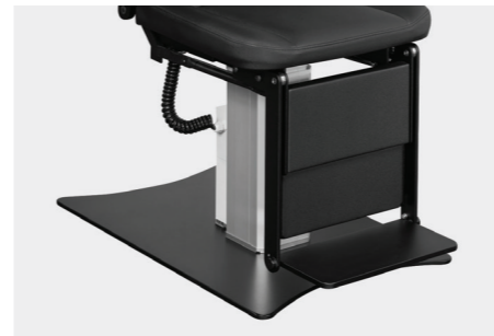
Fußstütze mit ausklappbarem Fußaustritt footrest with fold-out