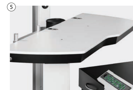
5 Manueller Schwenktisch mit einer oder zwei Positionen mit Magnetbremse Manual swivel table with one or two positions with magnetic brake