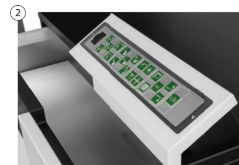
2 Antibakterielle Folientastatur mit oder ohne Beleuchtung Antibacterial foil keyboard with or without illumination