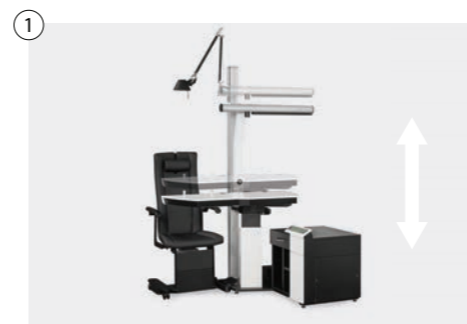
1 Einheit elektromotorisch stufenlos höhenverstellbar (ca. 73-103 cm) Unit electromotive infinitely height-adjustable (approx. 73-103 cm)