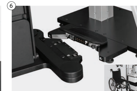
6 Kabellose mechanische Stuhlverschiebung in jede Richtung - Spezialeinklinksystem Wireless mechanical chair movement easily rollable in any direction - special latching system