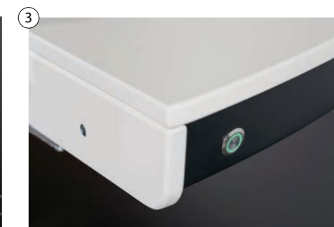
3 Stufenlose magnetische Fixiereinrichtung Stepless magnetic fixing device