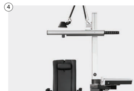
4 Physiologischer Phoropterarm vorgeneigt oder mit stufenloser Neigevorrichtung Physiological phoropter arm pre-tilted or with stepless tilting device