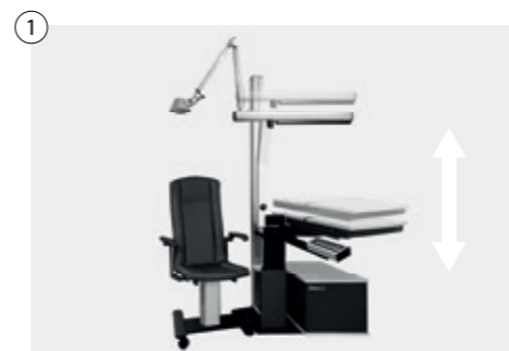
1 Einheit elektromotorisch stufenlos höhenverstellbar (71 cm - 101 cm) Unit electromotive infinitely height-adjustable (71 cm - 101 cm)