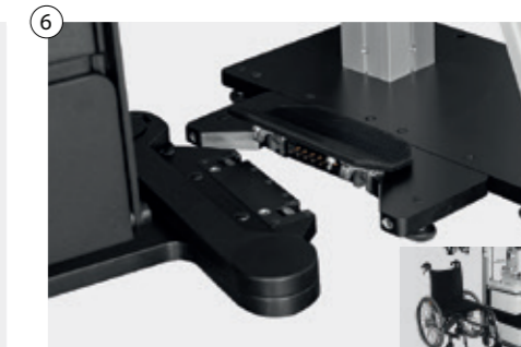
6 Kabellose mechanische Stuhlverschiebung in jede Richtung - Spezialeinklinksystem Wireless mechanical chair movement easily rollable in any direction - special latching system