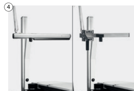
4 Physiologischer Phoropterarm vorgeneigt oder mit stufenloser Neigevorrichtung Physiological phoropter arm pre-tilted or with stepless tilting device