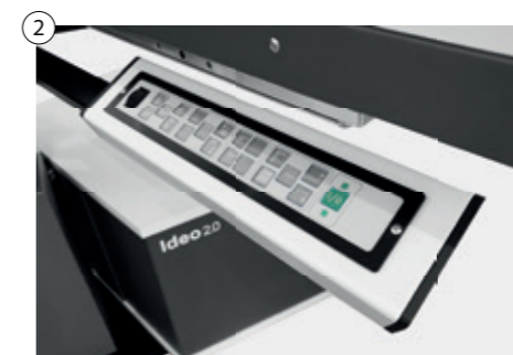
2 Antibakterielle Folientastatur mit oder ohne Beleuchtung Antibacterial foil keyboard with or without illumination