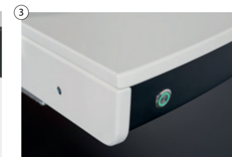
3 Stufenlose magnetische Fixiereinrichtung Stepless magnetic fixing device