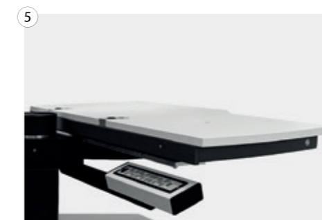
5 Manueller Schwenktisch mit einer oder zwei Positionen mit Magnetbremse Manual swivel table with one or two positions with magnetic brake