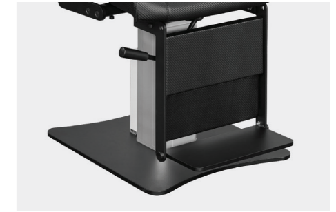
Fußstütze mit ausklappbarem Fußauflritt footrest with fold-out