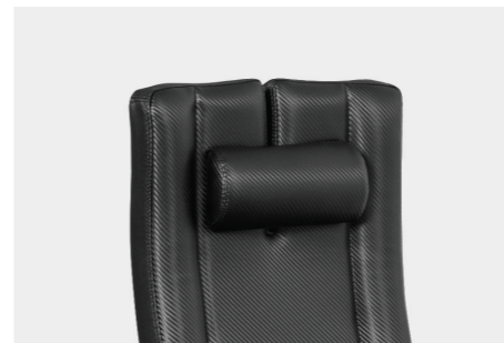
verstellbare Nackenstütze (nur bei CaraT®) adjustable neck support (only CaraT®)