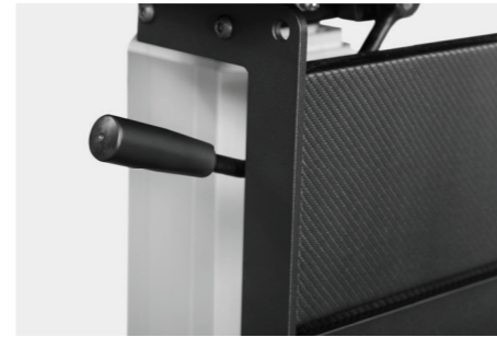
mechanische Sitzverschiebung mechanical seat shift