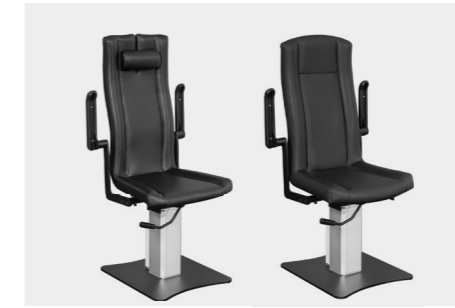
verstellbare Armlehnen adjustable armrests