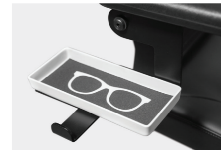
Bri-Ta® Taschen- und Brillenanlage Bri-Ta® pocket and spectacle system